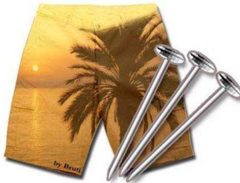
Bermuda - háromszög